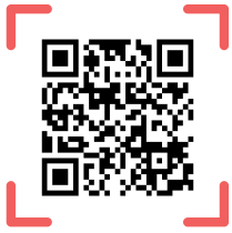
QR코드스캔 관리페이지 바로접속