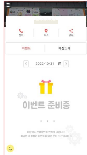
▲ 이벤트모듈이 추가된 모습